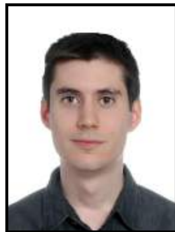
✗ FOTO CON BORDE