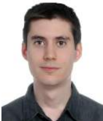
✓ FOTO CORRECTA