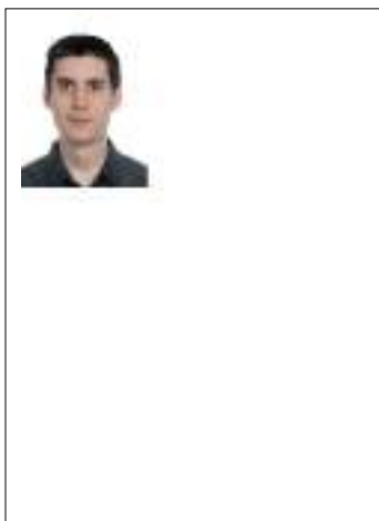
✗ FOTO CON EXCESO